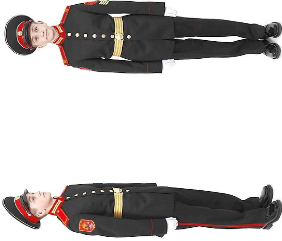
Парадная форма одежды